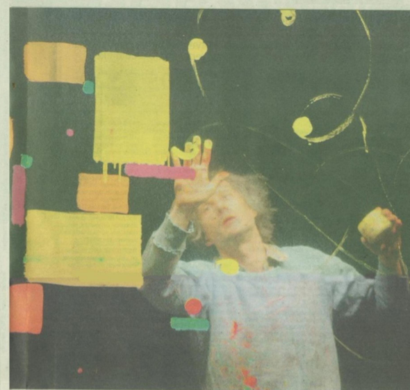
PUPPET THEATRE: Mario, by Cie Rue Barree (far left) and What Does Red Do on Thursday? by Thalias Kompagnon (left)