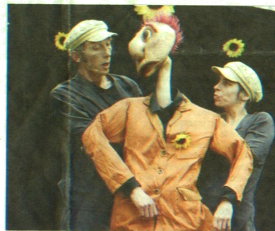
La compagnie girondine Rue barrée et sa marionnette Mario.

De plus, pendant les Préalables, les communes vont animer leur soirée avec différentes activités. Trois d'entre elles proposent des vide-jouets pour faire participer les en-