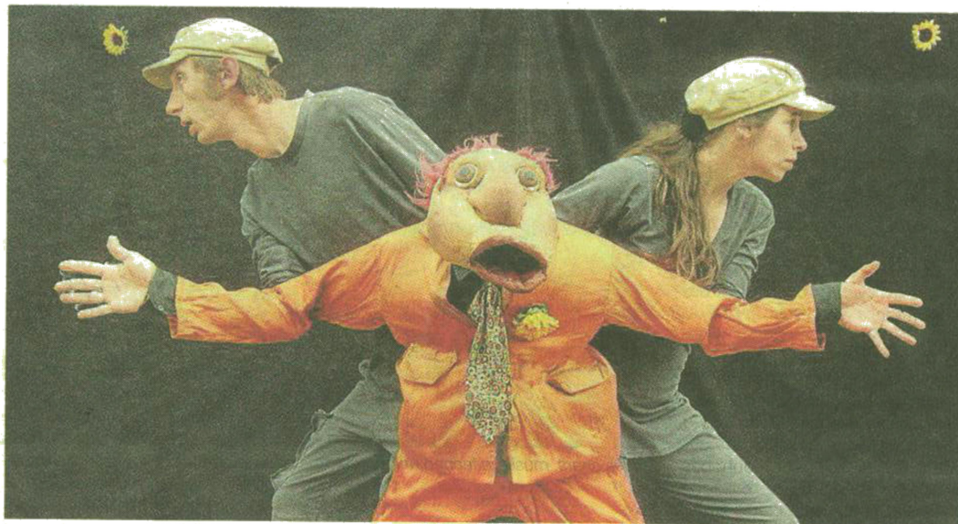
Mario , la marionnette de la compagnie Rue Barrée, se produira dans les jardins du moulin.

Les artistes grégoriens ne sont pas oubliés, puisque quatorze jeunes acteurs (11-14 ans) du théâtre de la Gâterie interpréteront l'île des enfants perdus , une création de Matthieu