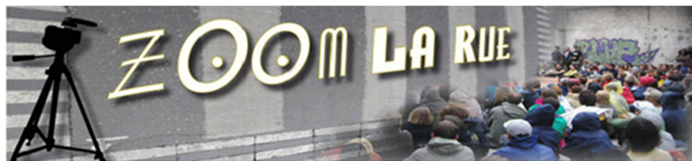
Rue Barrée – Mario

— Le Zoom & Cies de la Cie Rue Barrée – Mario , filmé durant le 25e Festival International de théâtre de rue en 2010 à Aurillac (15).