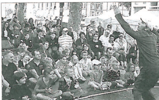
son auditoire, rue des Mêmes.

Au plus fort de la manifestation, cheminer en des lieux transformés en goulets d'étranglement demande de la patience. Les poussettes se croisent tant bien que mal (plutôt bien), les plus pressés s'énervent, les (nombreux) chiens stressent et les glaces fondent vite, elles qu'il faut consommer tout en prenant garde de ne pas écraser un orteil. Le maître mot hier était sans conteste la lenteur.